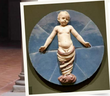
ELSKET: Relieffene av nyfødte er høyt elsket av Firences beboere. De er laget i terrakotta og malt blå.

– Plutselig befant jeg meg i en situasjon der jeg var alene hele dagen med en rasende tre-åring og en ettåring som veldig snart begynte å kalle meg mamma. Jeg var den eneste voksne, og barna hadde opplevd så mange ganger at voksne kom og forsvant etter kort tid. Jeg ble den første barnepike som var der et helt år, og etter hvert kunne barna oppleve at det var den samme voksne som ga trost hver dag. Det var gusomt å reise derfra. – Jeg tenkte mye på situasjonen jeg var i som au pair, da jeg i boken skildret ammens store sorg ved å måtte forlate barnet. Selv om det ikke var hennes eget, må det ha vært vanskelig.